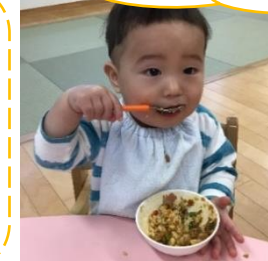
とっても美味しいよ!

食べることが大好きなひばり組です(笑) たくさん体を動かして遊んだ後はお腹がペコペコ。手掴み食べやスプーン・フォークを使って自分で食べる喜びを感じながらもりもり食事をしています。コップを両手で支えてお茶を飲むのも上手になりましたよ😊