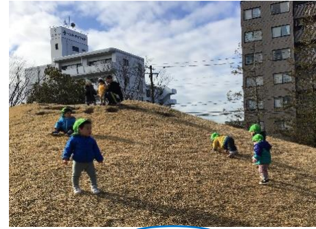
～ お散歩 ～